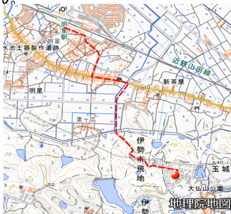
【国土地理院の地図を一部加工して使用】